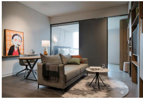
上海虹桥雅辰悦居酒店悦居套房