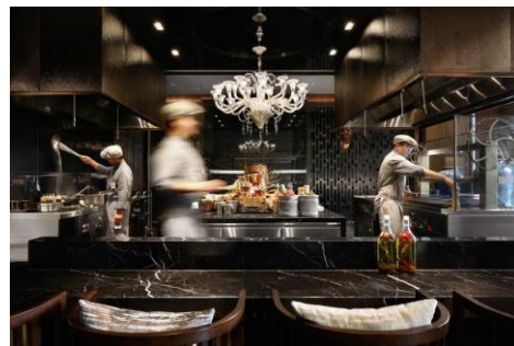
北京东直门酒店三合门餐厅