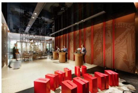
北京东直门雅辰悦居酒店抵达体验